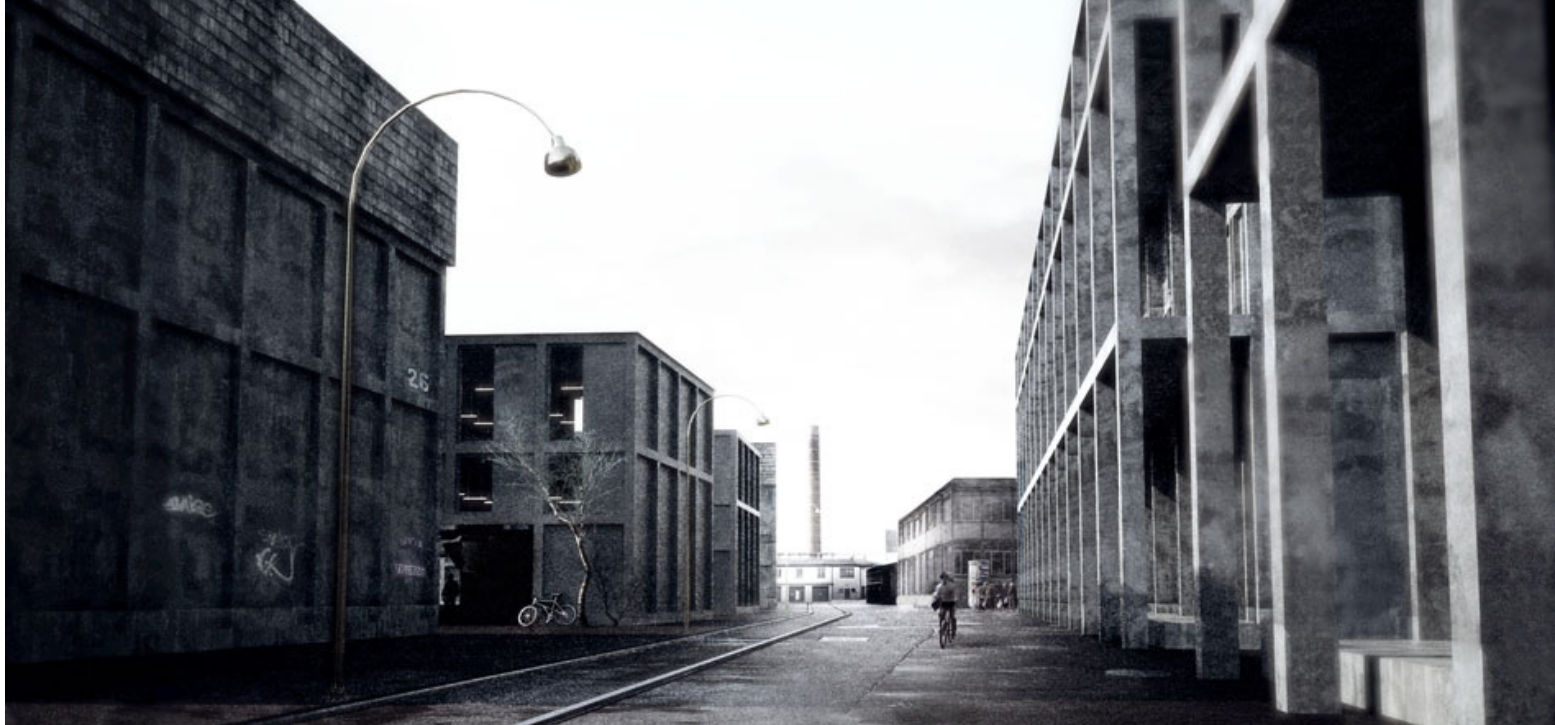
Bestehendes orientiert Neues, 3. Etappe