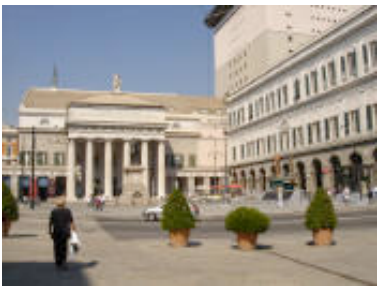
Theater von Aldo Rossi