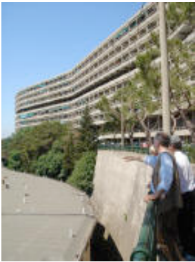
Roberto, perfekter Architekturführer

Ende der Exkursion, Mittagessen und Rückfahrt zum Bahnhof individuell