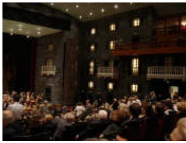
Tschaikovsky, 6. Sinfonie