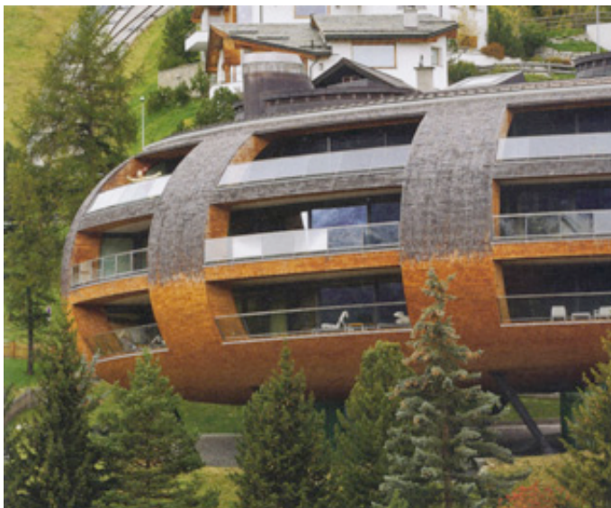
Chesa Futura St. Moritz, Arch. Norman Foster

Abfahrt ca.15.00h mit dem Postauto über Reichenau, Thusis, Besichtigung Via Mala, Traversinensteg und Punt da Suransuns, (Jürg Conzett), über das Oberhalbstein nach Savognin, Hotel Cube (Baumschlager - Eberle), dann über den Julier nach St.Moritz.