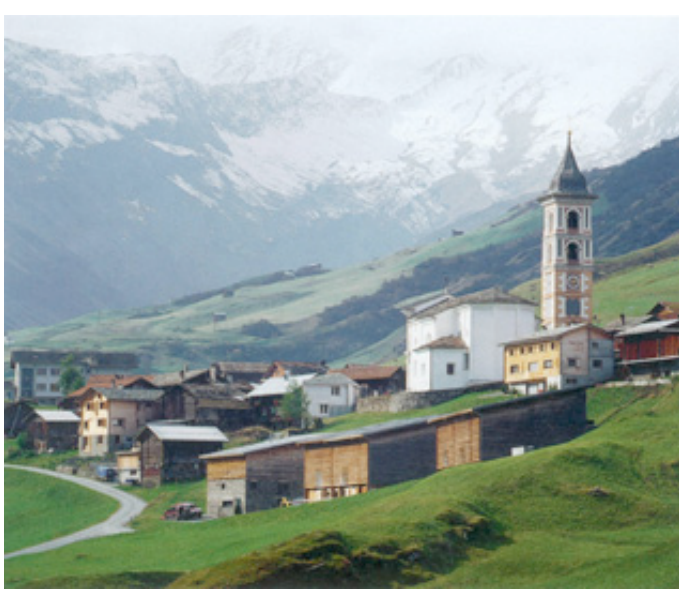
Vrin, Stallbauten Arch. G. Caminada