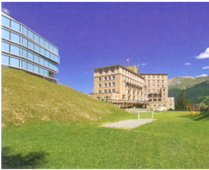
Hotel Castell Zuoz, UN Studio und H.J. Ruch