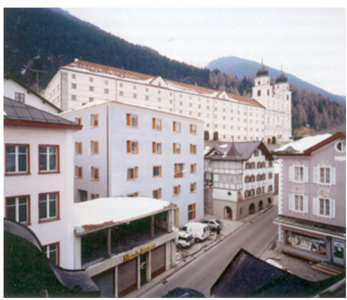
Disentis, Mädcheninternat Arch. G. Caminada