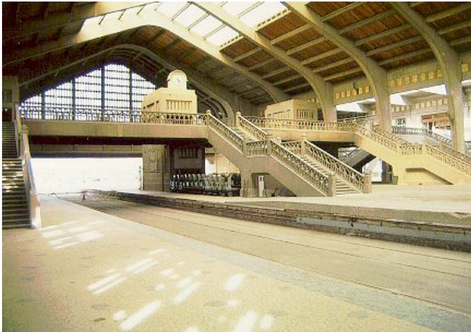
Cherbourg, Gare maritime

A Caen le matin, promenade à pied rue St. Pierre, rue Ecuyère, Abbaye aux Hommes, rue St. Sauveur, rue Froide, Office de Tourisme pour étudier la maquette de la ville, Place Courtonne, Quartier le Vaugueux, rue des Chanoines, Abbaye aux Dames, Bassin St.Pierre, rue de Bernières, nouveau Palais de Justice (visite possible avant midi?).